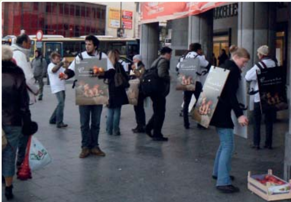
Actie bij de voorstelling van het Living Planet Rapport 2008. WWF biedt de reizigers een plaatselijk en biologisch gekweekte rode appel aan: een symbolische manier om iedereen even te laten nadenken over zijn consumptiegedrag. Centraal-Station, Brussel.

Alle twee jaar publiceert het WWF-netwerk het Living Planet Rapport , dat de balans opmaakt van de gezondheidstoestand van onze planeet. Het rapport stelt de impact van de mens op de planeet voor met behulp van de indicator de 'ecologische voetafdruk' die het mogelijk maakt om ons verbruik van natuurlijke rijkdommen te vergelijken met het vermogen van de aarde om die rijkdommen te vernieuwen.