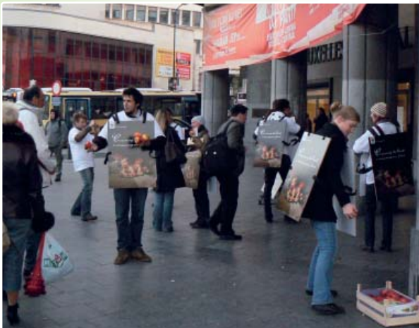
Action de lancement du Rapport Planète Vivante 2008, Gare de Bruxelles-Centrale. Le WWF offre aux voyageurs une pomme rouge bio et locale : une manière symbolique d'inciter chacun à réfléchir sur sa consommation.

Tous les deux ans, le réseau du WWF publie le Rapport Planète Vivante , véritable bilan de santé de notre planète. Il présente l'impact de l'homme sur la planète grâce à un indice, « l'empreinte écologique » qui permet de comparer notre consommation de ressources naturelles et la capacité de la Terre à renouveler ces ressources.