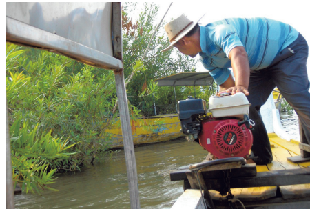
En van de rivierbewakers maakt zich klaar om uit te varen. 'De dolfijn beschermen is onszelf beschermen.'

"Als wij ons bos niet beschermen, zou het in beslag genomen worden door de rijken", zegt Sem, terwijl hij ons de kippen toont. "Daar zijn we bang voor. Wij hebben dit land nodig. Op de markt krijgen we een goeie prijs voor wilde paddenstoelen en honing uit het bos. Het is niet even veel als de 300 dollar die je krijgt voor een zwijnshert, maar die zijn er toch bijna niet meer."