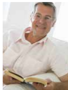
Monsieur G. H., Bruxelles

« Pourquoi me suis-je rendu chez le notaire pour mettre le WWF dans mon testament ?