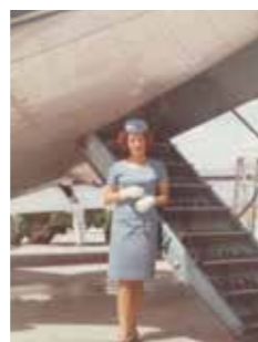
Madame V., Nethen

Le legs en duo me permet de faire un petit geste pour une famille, avec deux enfants, qui m'est chère et cela, sans qu'elle subisse de lourds frais de succession. Enfin, il me semble que mon action, ma décision, me relie aux sentiments humanistes d'un ami décédé qui m'est toujours très cher. »