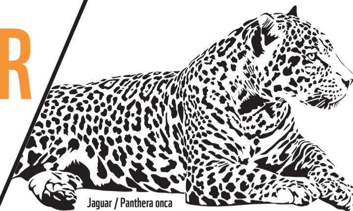
Jaguar / Panthera onca