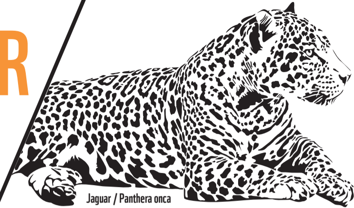
Jaguar / Panthera onca