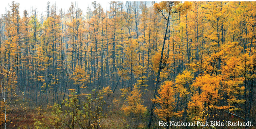
Het Nationaal Park Bikin (Rusland).

In mei vond Vladik er zijn vrijheid terug.