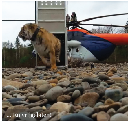
... En vrijgelaten!

Cameravallen en gps-halsbanden vormen een ware goudmijn voor ons onderzoek naar wilde dieren. Ze laten ons toe na te gaan welke wereldwijde locaties onze bescherming het dringendst nodig