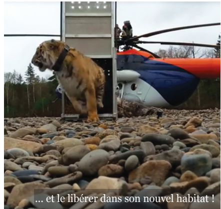
... et le libérer dans son nouvel habitat !

Étudier les animaux grâce aux caméras-pièges et aux colliers GPS représente une mine d'or pour nous, car cela nous permet notamment d'identifier les lieux clés à protéger en priorité dans le monde.