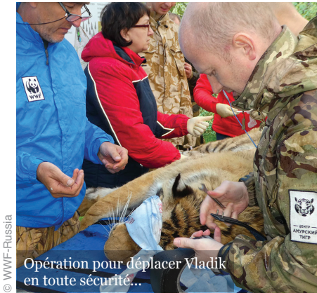
Opération pour déplacer Vladik en toute sécurité...

Affublé d'un collier GPS, Vladik pouvait ainsi refaire sa vie, tout en étant discrètement suivi. Vladik a encore des envies de voyage : en six mois, le félin a parcouru pas moins de 650 kilomètres. Il s'approche encore de temps à autre de villages... Mais en faisant preuve, cette fois, d'une grande prudence. Où s'installera-t-il ? Seul le temps nous le dira.