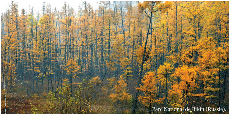
Parc National de Bikin (Russie).

A en croire les caméras-pièges permettant d'étudier la région, le Parc offrait tout ce dont Vladik avait besoin : un espace protégé, une belle population d'environ 30 tigres, et un nombre suffisant de proies. Vladik y fut relâché en mai dernier.