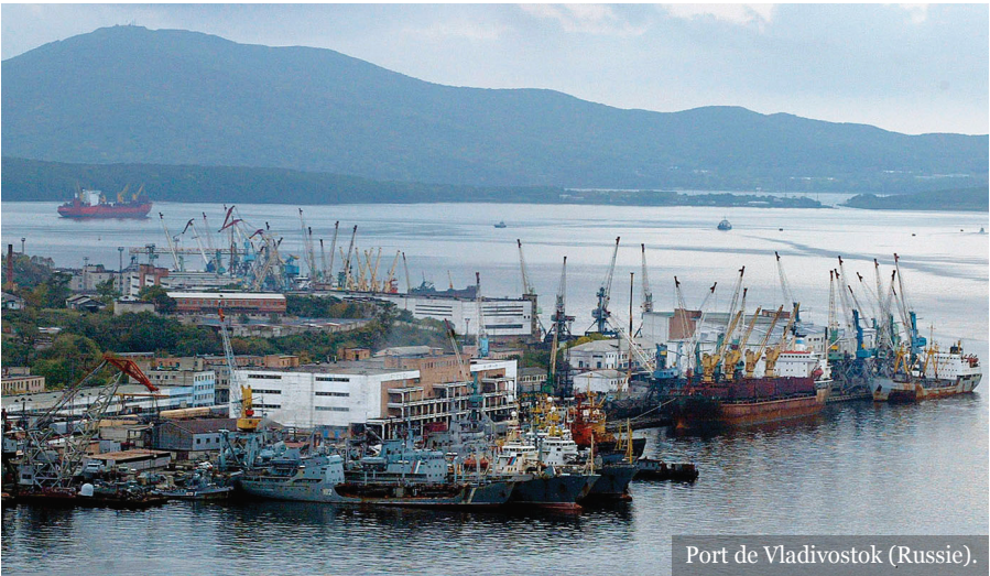
Port de Vladivostok (Russie).

Évidemment, la vue de ce tigre en milieu urbain avait immédiatement fait sensation auprès de la population locale... La Une des journaux locaux et internationaux fut prise d'assaut par cet improbable récit. Et s'il était bien tentant pour certains d'abattre l'animal, la police et le WWF-Russie ne l'entendaient pas de cette oreille.