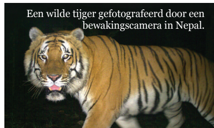
Een wilde tijger gefotografeerd door een bewakingscamera in Nepal.

In het Nationaal Park van Banke, dat sinds een paar jaar beschermd is, betrekken we de lokale bevolking bij de natuurbescherming. De dierenpopulaties, waaronder die van de tijgers, nemen er toe en het ecotoerisme bloeit er volop!