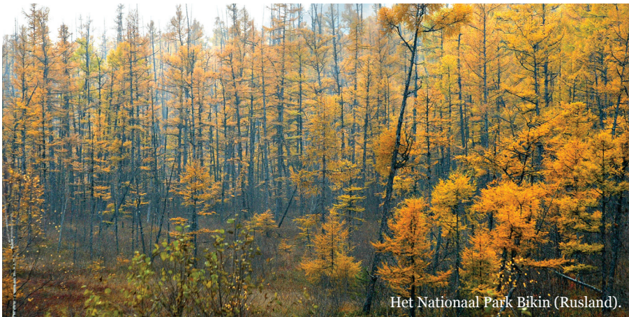
Het Nationaal Park Bikin (Rusland).

In mei vond Vladik er zijn vrijheid terug.