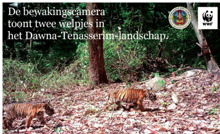
De bewakingscamera toont twee welpjes in het Dawna-Tenasserim-landschap.

In de streek van Dawna-Tenasserim beschermen we de habitat van de tijgers. Tegelijk ondersteunen we de lokale gemeenschappen en beschermen we de grootste rivieren in de regio, evenals talloze bedreigde diersoorten (de Aziatische olifant, de Siamese krokodil, het luipaard ...). Het gevolg hiervan is dat de tijgerfamilies er weer groeien. Het bewijs? De tijgerwelpen die recent nog voorbij een van onze cameravallen wandelden!